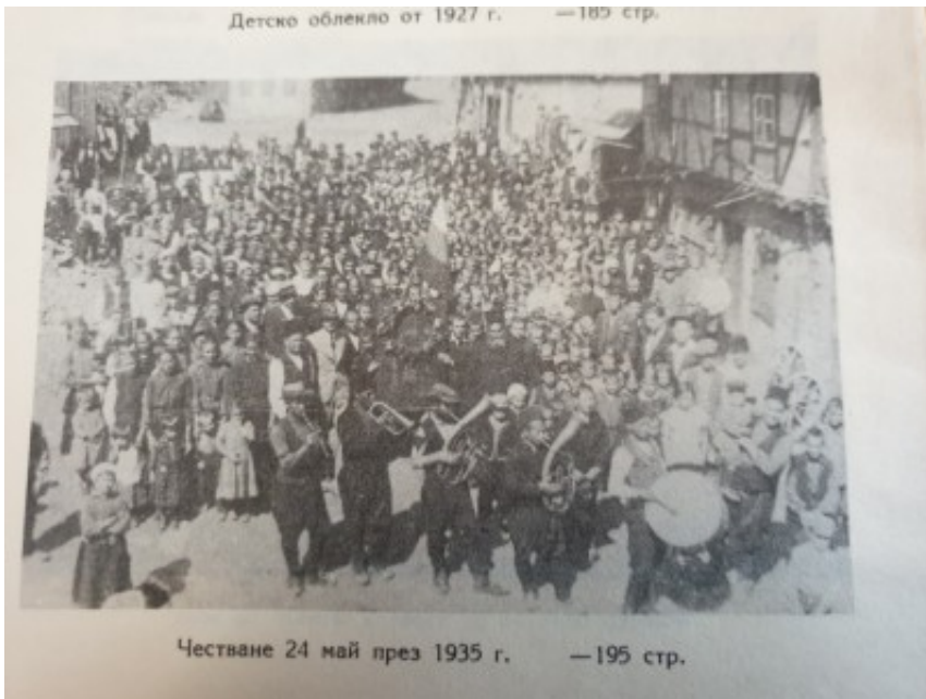
Честване 24 май през 1935 г. —195 стр.