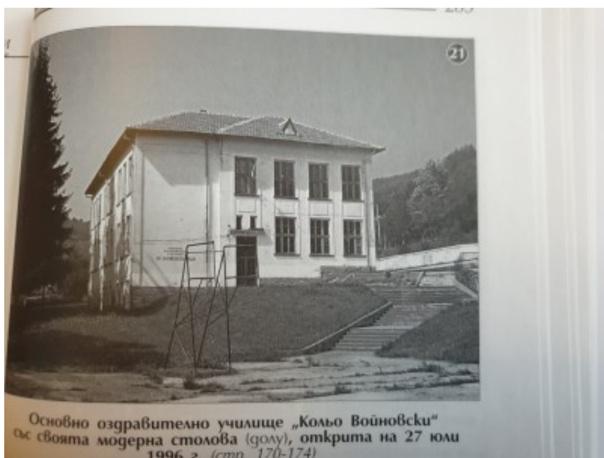
Основно оздравително училище „Кольо Войновски“ с своята модерна столова (долу), открита на 27 юли 1996 г. (стр. 170-174)