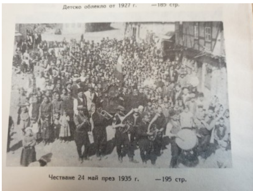
Честване 24 май през 1935 г. —195 стр.