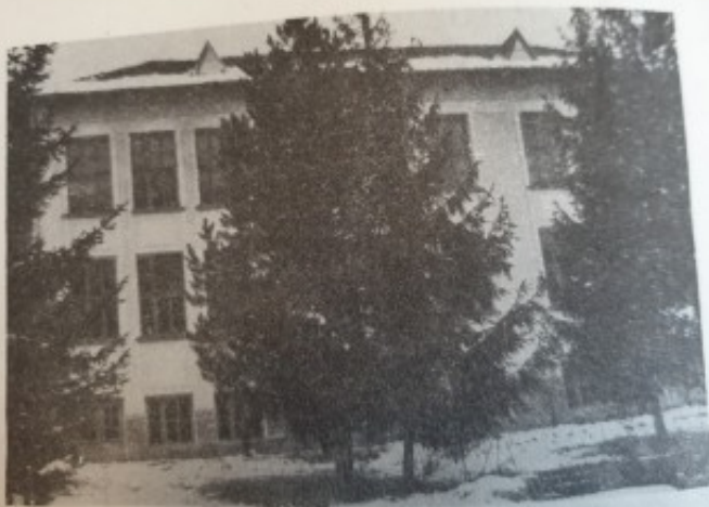
Новото училище от 1936 г. —104 стр.

Незавършеният строеж-мастодонт в местността Крушово над курорта има 11 етажа над земята и 4 под земята. Днес се руши. Дали някога струващата над 100 милиона лева сграда ще бъде завършена? (стр. 110 и 217)